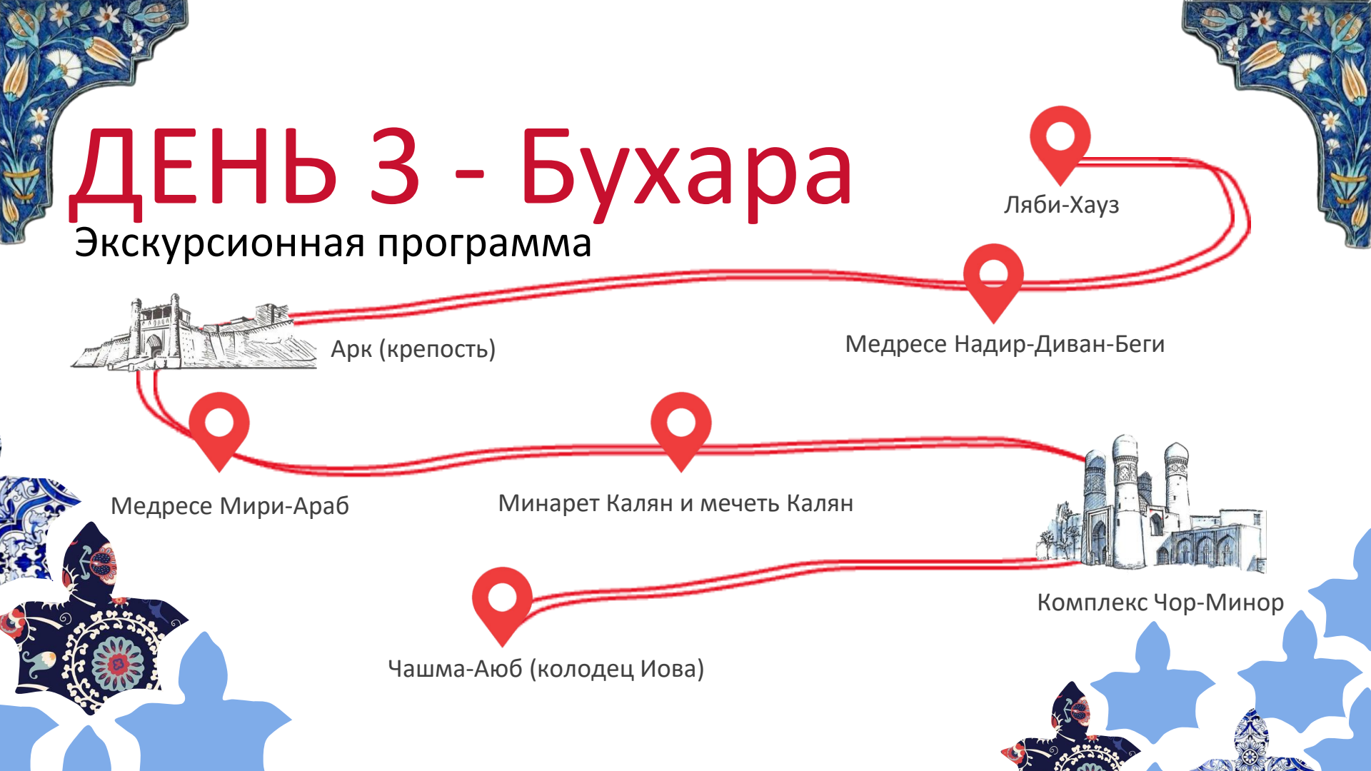
Чашма-Аюб (колодец Иова)